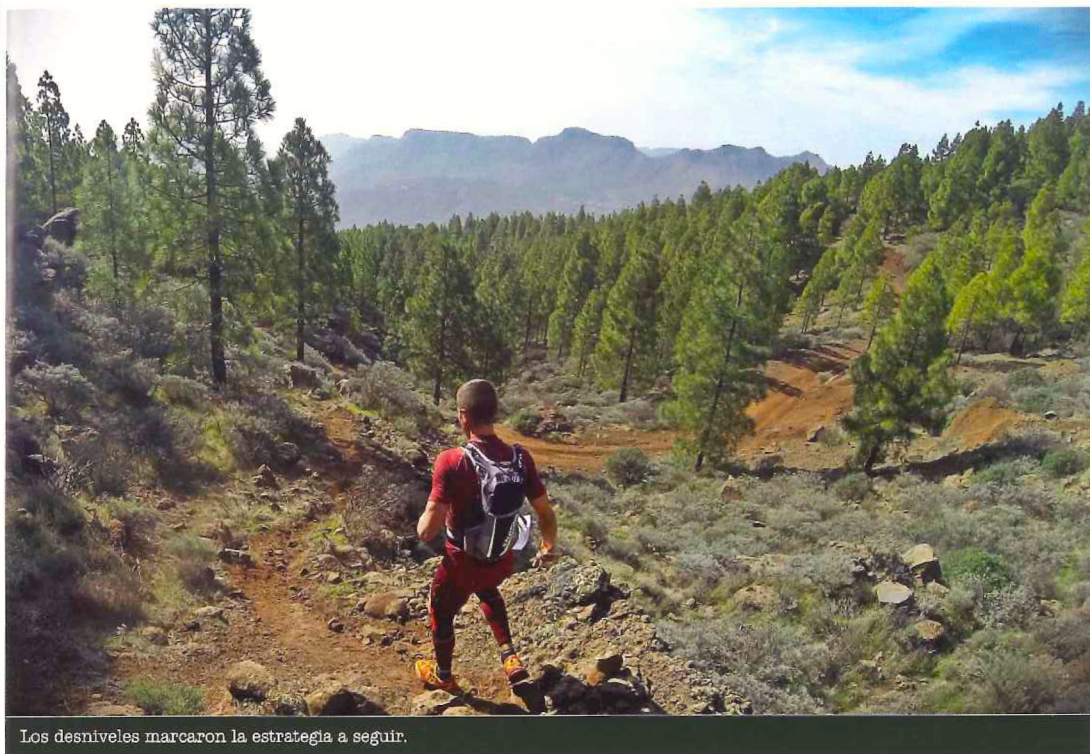
Los desniveles marcaron la estrategia a seguir.

característicos de la zona, pues cuenta con un mirador desde donde contemplar la Caldera de Tirajana y el parque Rural del Nublo.